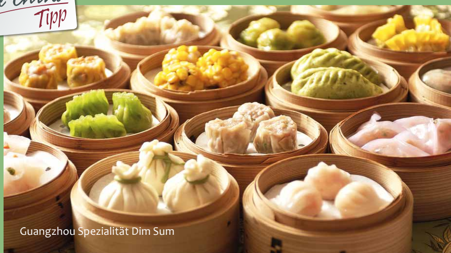
Guangzhou Spezialität Dim Sum

Die südchinesische Küche: Im Süden Chinas wird recht mild gekocht. Die Speisen erhalten ihren würzigen Geschmack durch Zutaten wie Ingwer, Frühlingszwiebeln und Knoblauch. Auch Essig spielt eine große Rolle. Bekannt ist sicherlich das beliebte „Schweinefleisch süßsauer“, das aber bei weitem nicht die beste Spezialität. Vor allem die kleinen Teigtaschen, Dim Sum genannt, werden gerne als Vorspeise zu jeder Mahlzeit gegessen. Es gibt sie mit pikanten Füllungen (Probieren Sie die mit einer Füllung aus Shrimps!), aber auch mit einer feinen süßen Paste gefüllt. Natürlich gibt es auch zahlreiche vegetarische Varianten!